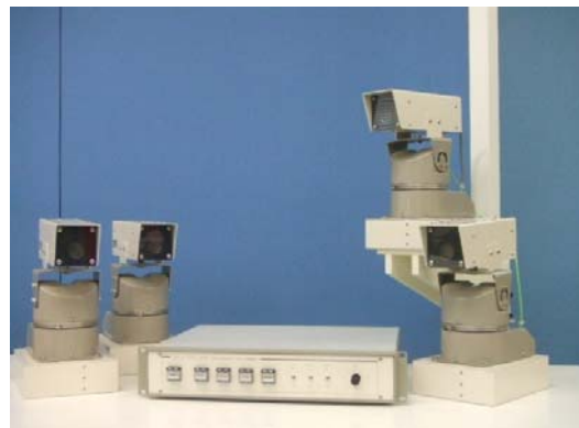
CCTVカメラを最大で4台まで制御