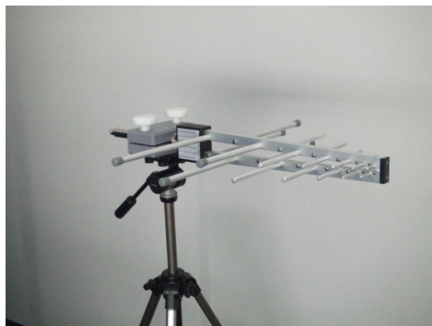
※三脚及びアンテナホルダはオプション対応

UHALP9108AログペリオディックアンテナはドイツSchwarzbeck社製です。 EMI放射雑音測定用アンテナとして標準的に使用されているアンテナです。 イミュニティ試験用アンテナとしても使用出来ます。